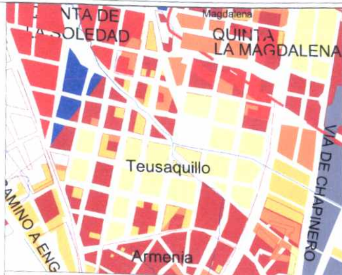
CRECIMIENTO HISTÓRICO - CRONOLOGÍA