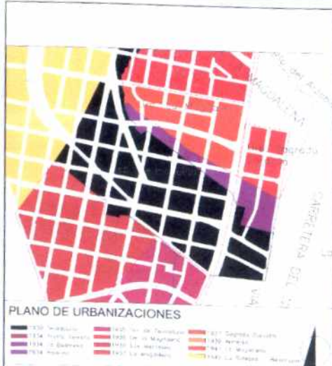
PLANO DE URBANIZACIONES

Su propuesta reticular, sin embargo, se pliega a los accidentes y permite la aparición de diagonales y formas de manzanas correspondientes. El parque como centro de la composición original mantiene su prelación y de allí parten las vías principales o lo circundan.